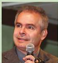
PEDRO GAMIO Ex ministro de Energía y Minas, Consultor.